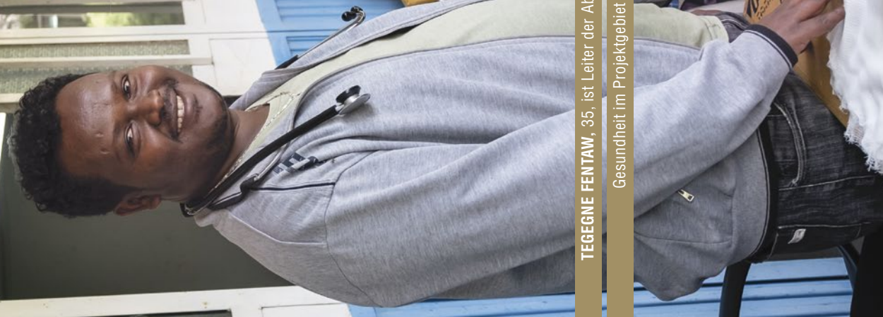
TEGEGNE FENTAW , 35, ist Leiter der Abteilung

„Viele Krankheiten lassen sich durch Aufklärung eindämmen.“