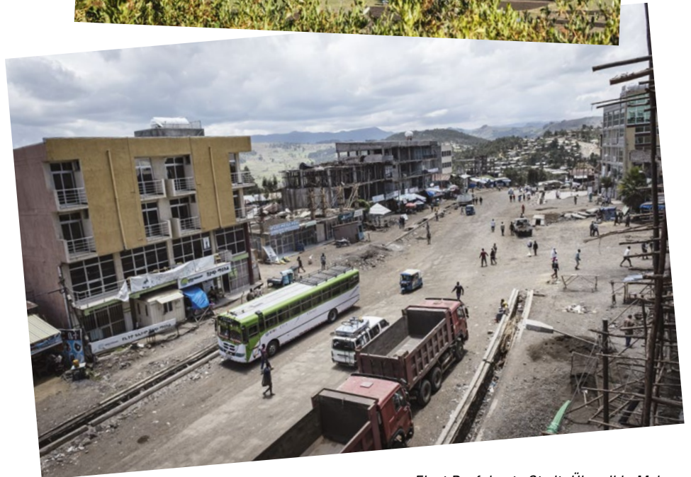
Einst Dorf, heute Stadt: Überall in Mekane Selam werden Straßen und Gebäude errichtet.