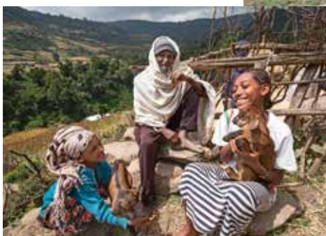
Rund 80 Menschen leben in der Glaubensgemeinschaft Mentiq Gedam. Jung und alt helfen einander, beten, arbeiten und leben zusammen.