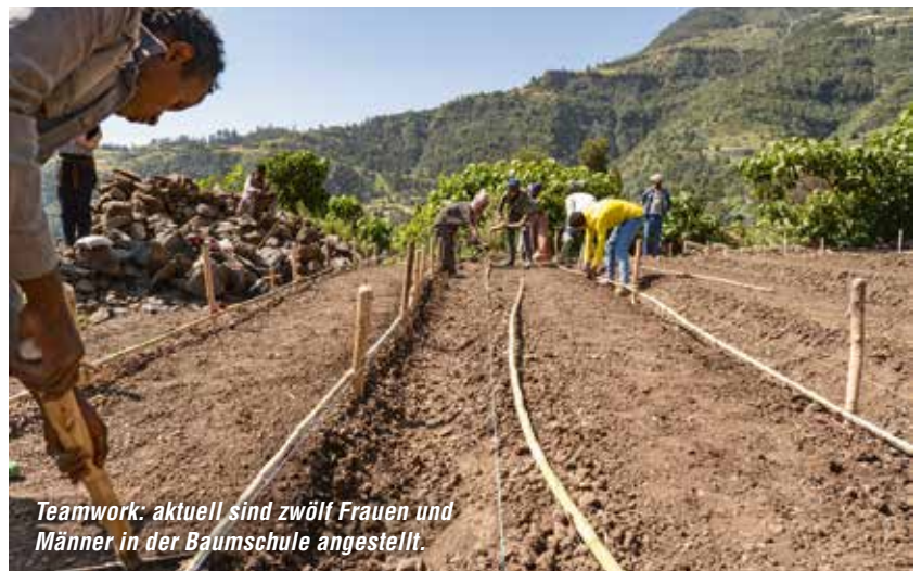
Teamwork: aktuell sind zwölf Frauen und Männer in der Baumschule angestellt.

ckend und offen für Veränderung, sind wichtig für Menschen für Menschen . Besonders zu Beginn eines neuen Projektes. „Ihre Nachbarn sehen die Erfolge der Modellbauern und interessieren sich ebenfalls für unsere Arbeit.“