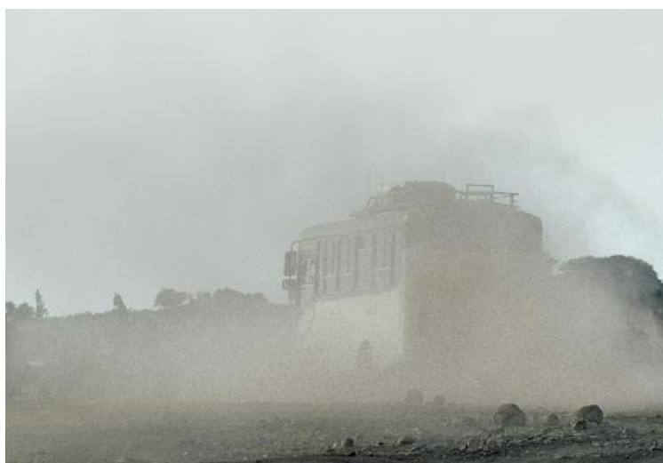
Feiner Staub, den ein Bus auf einer Straße in Agarfa aufwirbelt, zeugt von der Trockenheit in der Region.

Dürre und Hunger in Äthiopien: Das weckt Erinnerungen. Von 1983 bis 1985 erlebte das Land das größte Hungersterben Afrikas der vergangenen Jahrzehnte. Die Zahl der Opfer wird auf eine halbe Million bis eine Million