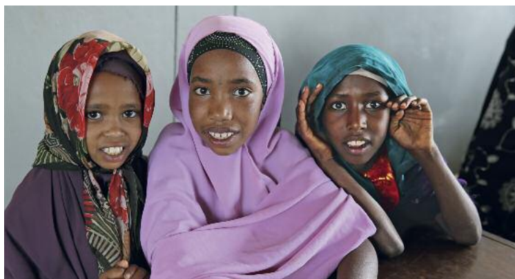
Der Filmbeitrag zur Schuleröffnung:

Heute lernen die Kinder in hellen Räumen mit neuen Sitzbänken und Tischen.