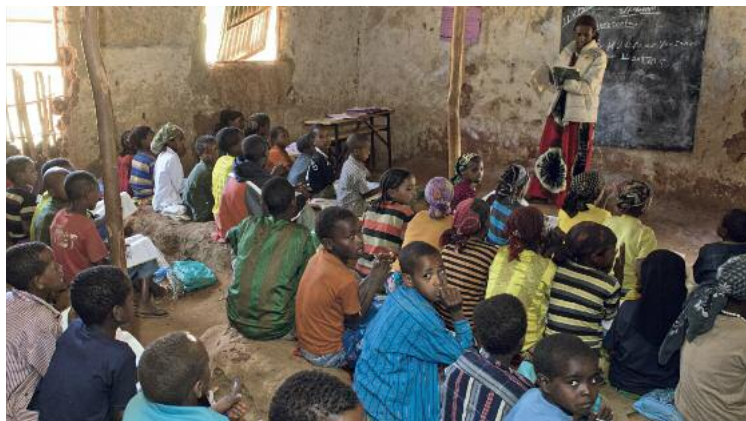
Unwürdige Verhältnisse: verfallene Gebäude der alten Schule von Gefre Guda.